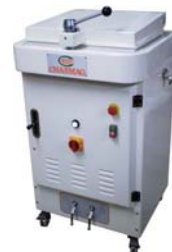
Hydraulic Divider 麵團分割機