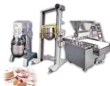
Cake Production Line 蛋糕生產線