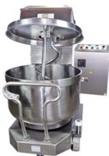
Spiral Mixer (Removable Bowl) 螺旋攪拌機 (離缸式)