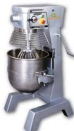
Planetary Mixer 直立式攪拌機