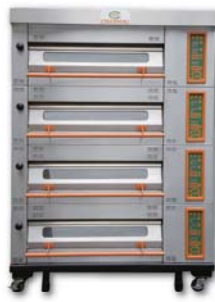
Electric Deck Oven - Digital 遠紅外線電烤爐