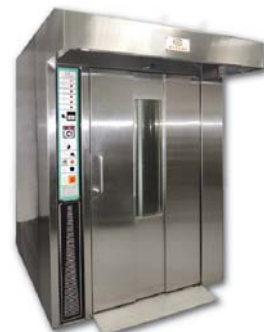
Rotary Rack Oven 台車爐