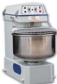
Spiral Mixer 螺旋攪拌機