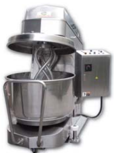
Twin Twist Mixer 雙扭轉鉤攪拌機