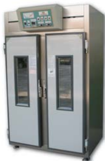
Retarder Proofer 凍藏發酵箱