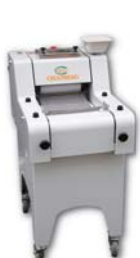
Mini Dough Moulder / Baguette Moulder 法國麵包整型機