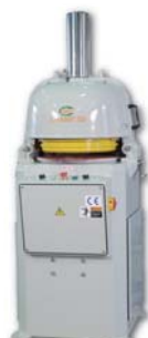
Auto. Divider Rounder 全自動分割滾圓機