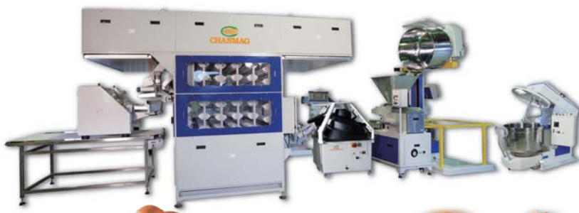
Bread Production Line 麵包生產線