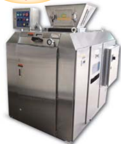
6 pistons Volumetric Dough Divider 連續式六口分割機